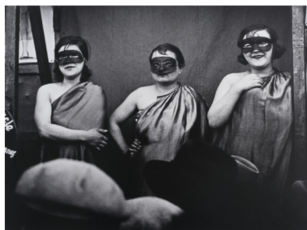
Brassai Les trois femmes masquées pour la Parade, Paris, France, 1931