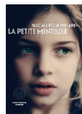
La Petite Mentreuse