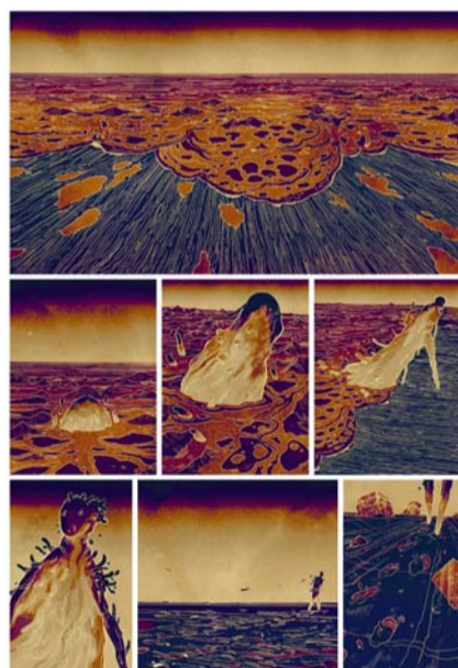
Carbone & Silicium par Mathieu Bablet © Label 619, Ankama Editions - 2020