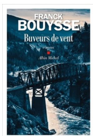
Buveurs de vent Franck Bouysse Éd. Albin Michel