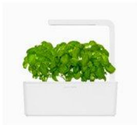
Click and Grow