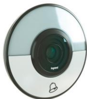
Le carillon connecté